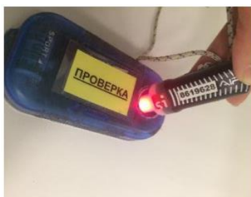
Рис. 3. Световой индикатор при успешной отметке (активации) ЧИПа SIAC

При использовании ЧИПа SIAC после очистки необходимо активировать бесконтактный режим ЧИПа в станции «ПРОВЕРКА», при этом станция «ПРОВЕРКА» и ЧИП SIAC издадут звуковые сигналы и срабатывают световые индикаторы (рис. 3). Затем следует убедиться в активации ЧИПа SIAC путём отметки в бесконтактной станции «ТЕСТ SIAC»: при успешной активации в момент отметки ЧИП SIAC издаёт звуковой сигнал, а затем начинает срабатывать его световой индикатор (рис. 4). Если ЧИП не срабатывает в станции «ПРОВЕРКА» или «ТЕСТ SIAC», то проведите повторную очистку ЧИПа.