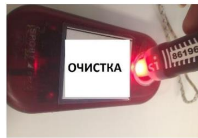
Рис. 2. Световой индикатор при успешной очистке ЧИПа SIAC