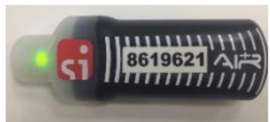
Рис. 4. Периодически мигающий зелёный световой индикатор говорит о том, что ЧИП SIAC активирован и готов к бесконтактной отметке