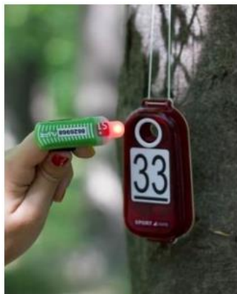
Рис. 5. Отметка в станции ЧИПом SIAC