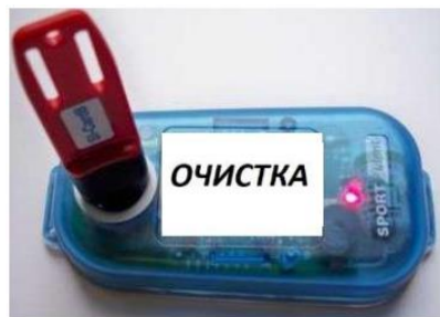
Рис. 1. Световой индикатор при успешной очистке контактного ЧИПа