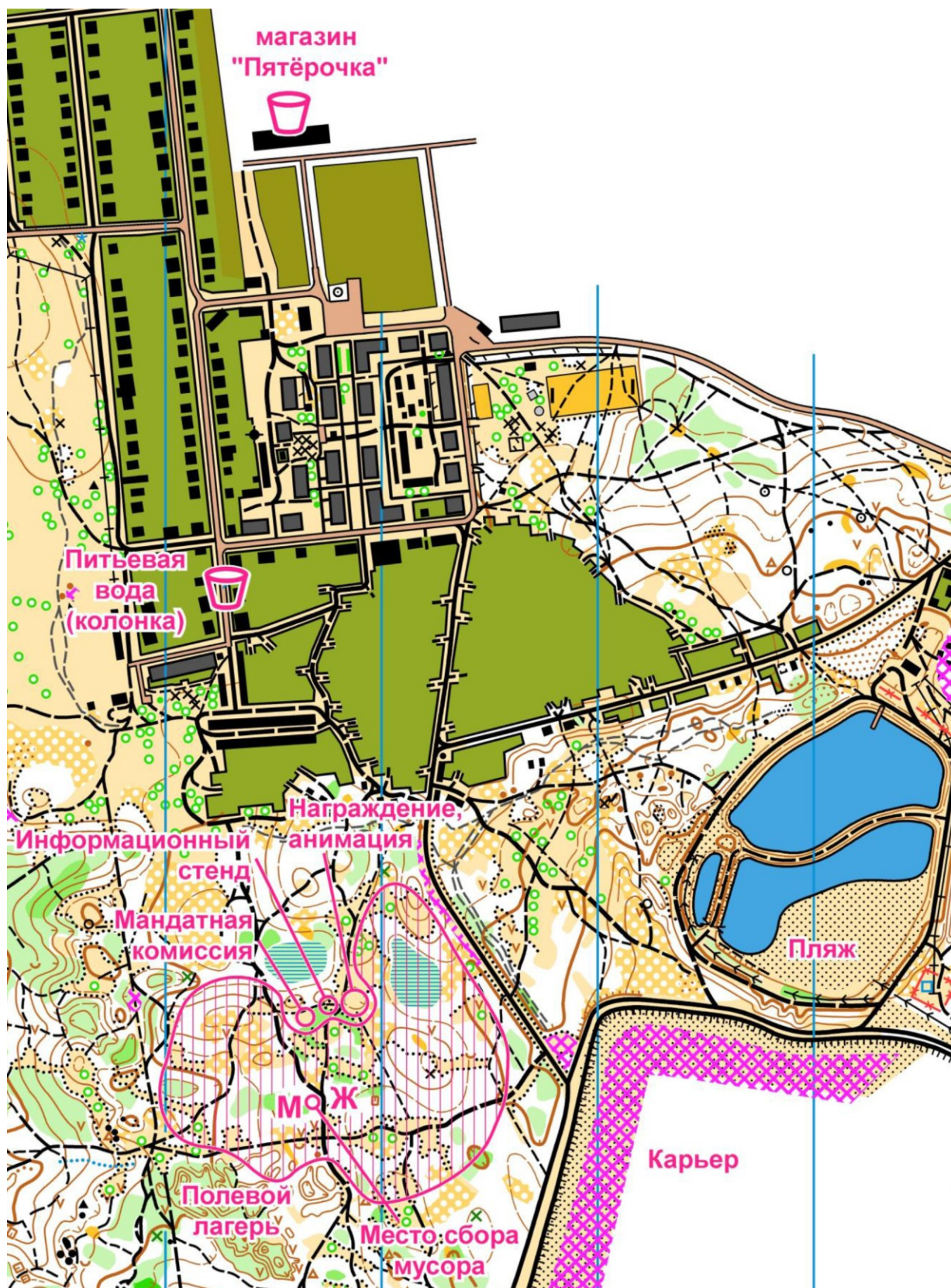
Схема полевого лагеря: