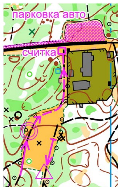
Схема арены соревнований:

После отметки на финише необходимо считаться в судейской машине!